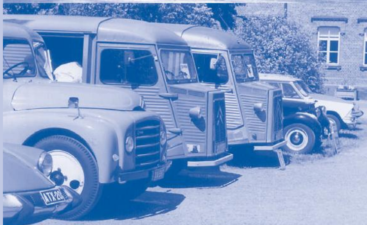
D-malli, T/U-23, HY eli Kamina, B-malli ja AMI