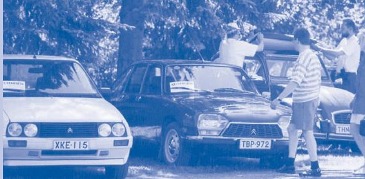
Visa, GS ja 2CV eli Rättisitikka