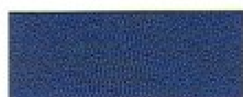
Bleu Stratos parelmoer