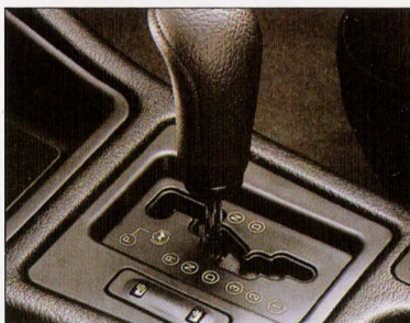
Conforto do câmbio auto-active.

Um automóvel de luxo: bancos de couro e elétricos.